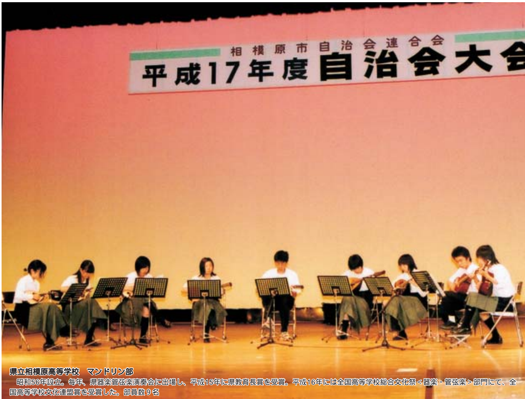
県立相模原高等学校 マンドリン部

事務局 〒229-0036 相模原市富士見6-6-23けやき会館内 TEL.042-753-3419 〒229-8611 相模原市中央2-11-15相模原市役所 市民生活課内 TEL.042-769-8226