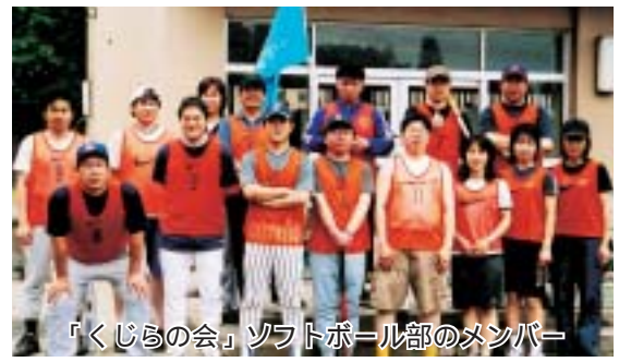
「くじらの会」ソフトボール部のメンバー

水の流れごとく、水の流れることく、無理のない自然体の運営が他の自治会から羨まれている所以かも知れません。