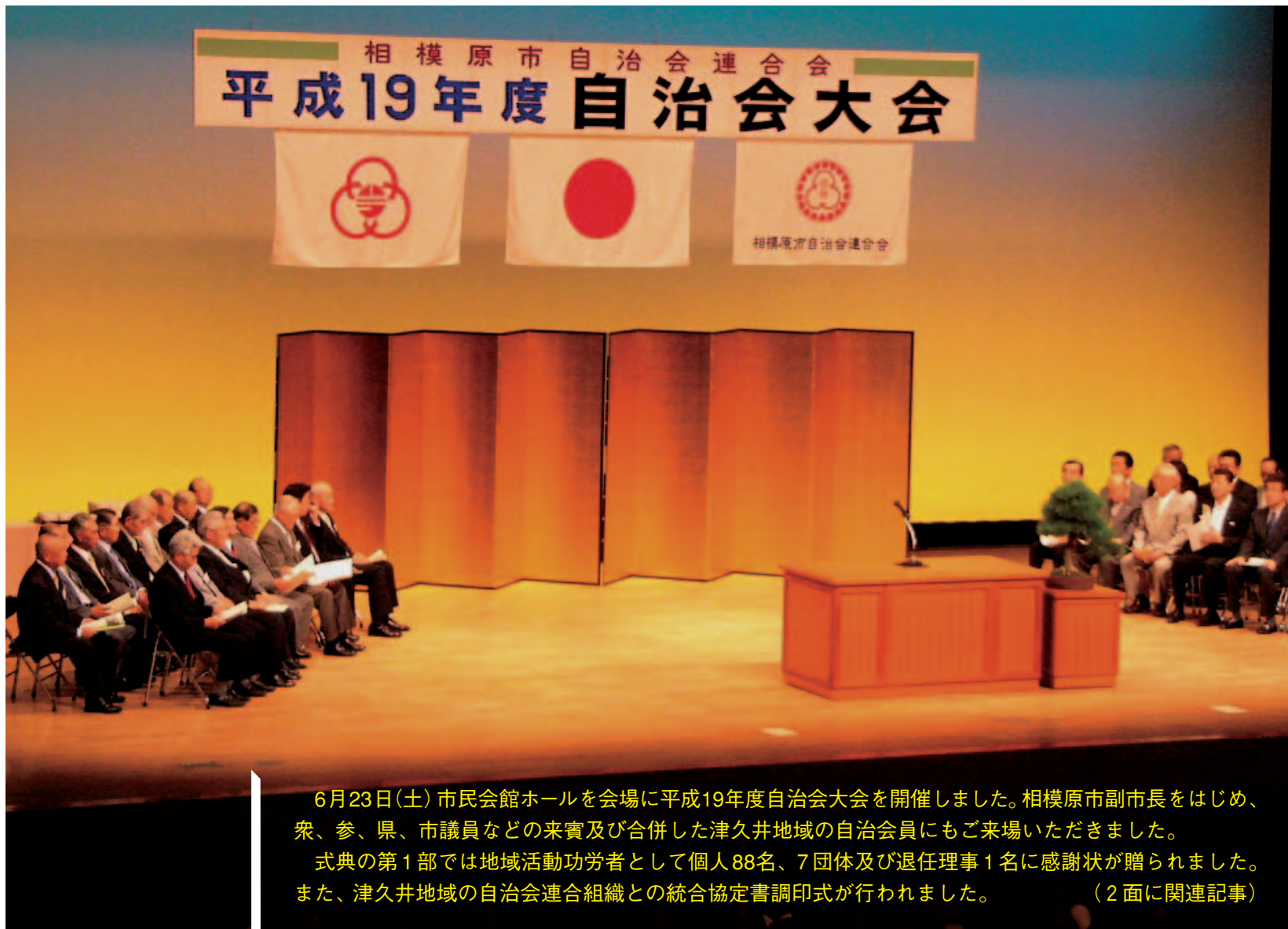
6月23日(土) 市民会館ホールを会場に平成19年度自治会大会を開催しました。相模原市副市長をはじめ、衆、参、県、市議員などの来賓及び合併した津久井地域の自治会員にもご来場いただきました。式典の第1部では地域活動功労者として個人88名、7団体及び退任理事1名に感謝状が贈られました。また、津久井地域の自治会連合組織との統合協定書調印式が行われました。(2面に関連記事)

事務局 〒229-0036 相模原市富士見6-6-23けやき会館内 TEL.042-753-3419 ●〒229-8611 相模原市中央2-11-15相模原市役所市民協働推進課内 TEL.042-769-8226