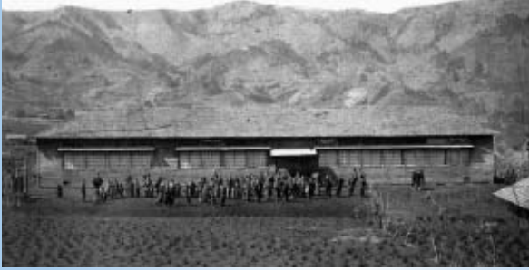
明治42年4月 日連村尋常高等日連小学校校舎落成