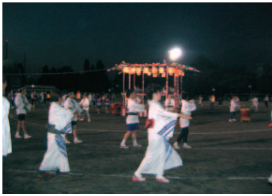
第30回を迎えた、本年度ふるさとまつり(9月8日・向陽小)

小山地区のふるさとまつりは今年で30回目を迎えた。昭和35年から開催していた運動会を昭和52年よりふるさとまつりとし、平成16年より盆踊り大会を加えた。運動会は各自治会の対抗で子供からお年寄りまで参加する。今年30回の記念大会ということもあり、真新しい真紅の優勝旗をめぐり大いに盛り上った。向陽鼓笛隊やお昼休みのフットダンスで交流を深め、野菜即売会、模擬店などで賑わいを増し、運動会をより一層盛り上げていた。