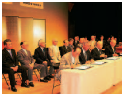
自治会大会で調印式が行われました

市連合会は、5月28日に3組織から統合の申し入れを受け、定期総会で統合に係る議案が承認されたことから、6月23日、自治会大会で統合協定書の調印式が行われました。