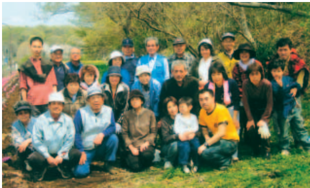
みんなで芝桜を植えました。来春はぜひ見に来てください。

昨年からの自治会・老人会・芝桜愛好会・新磯高校の協力で勝坂歴史公園の道路側に芝桜の植栽を始め、現在300メートルの長さになった。今秋10月には、更に左右70メートルに植栽をする予定。また、勝坂はキャンプ座間と隣接する地域で、特にヘリコプターの騒音や基地周辺の樹木が