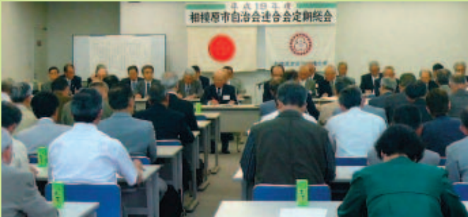
相模原市自治会連合会定期総会