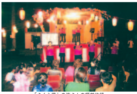
「さくら草」の皆さんの福前体操

自治会活動として八坂神社祭典を7月21日(土)に実施いたしました。午後1時から亀ヶ池宮司による式典後子供神輿が地域内を巡行し、子供達には楽しいひと時でした。夜はカラオケ大会を開催していましたが、近年参加される方が少なく、出演者を集めるのに苦労してまいりました。