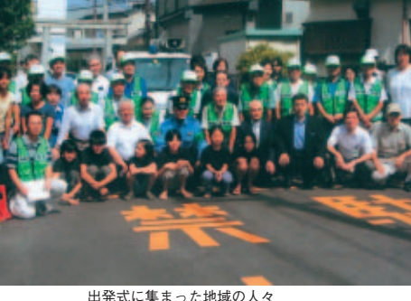
出発式に集まった地域の人々

隊員は、近隣の、相模地区自治会、上原町自治会等、当山王地域ソフトボールのメンバーにも加わって頂き、隊員30名が警察の講習を受け、パトロール実施者証も取得しました。軽トラに青色回転灯も装備し、いよいよ相模原警察署長の委嘱を受け自主防犯パトロール隊の出発準備が完了、華々しく去る8月23日出発式を行いました。