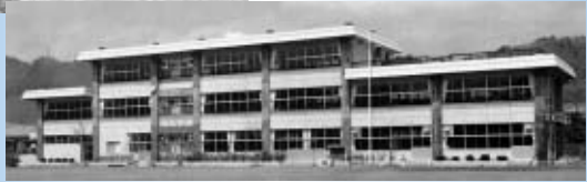
新校舎 (昭和52年完成)