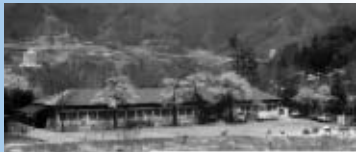
旧校舎全景 (昭和40年代撮影)