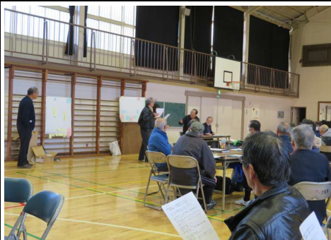
避難所運営ゲーム発表の様子

光が丘地区自治会連合会・避難所運営協議会連合会主催にて3回目(前期最終回)となる講習会が、緑2・防災隊員6名を含み、43名が参加して開催されました。最初に並木小学校、緑が丘中学校、青葉小学校、陽光台小学校、光が丘小学校の各避難所単位に分かれ、避難所運営ゲーム(HUG)を実施、それぞれの代表者が結果を発表、その後2つのグループに分かれ防災トイレの組み立てと救護訓練を実施しました。最後に3回の講習を受講した参加者に「終了証書」が交付されました。