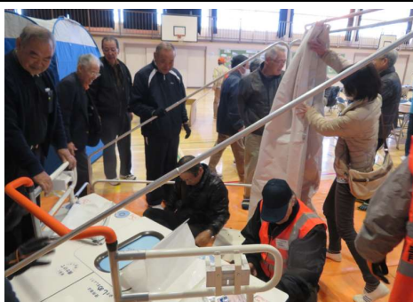
防災トイレ組立の様子