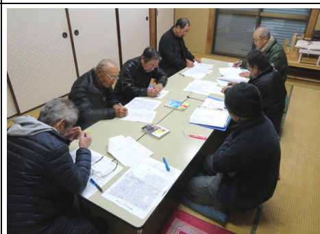
災害時支援希望者対応会議の様子

第1～第4地区の地区長および副地区長、合わせて9名が出席、本年度に提出された30件の災害時支援希望者への対応を地区毎に検討し、昨年度からの更新状況を確認するとともに、マップへの落とし込みを行い、今後の防災計画に生かしていくことになりました。なお、提出いただいた調査表で、緊急度の高い方を担当の地区長(副地区長)が訪問して事情をお聞きいたします。