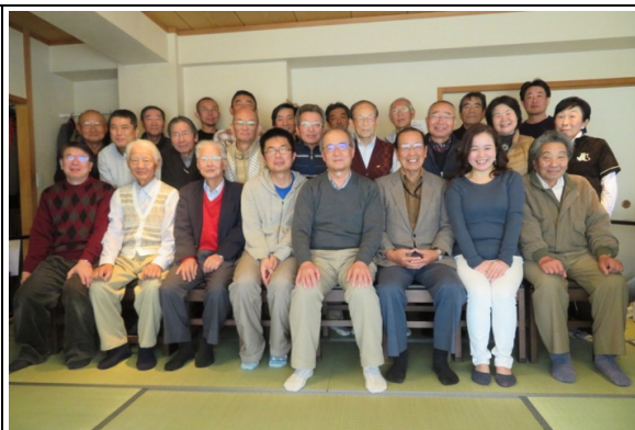
定例会兼忘年会に参加した隊員