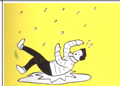
防災ブック「東京防災」より