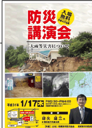
防災講演会のチラシ