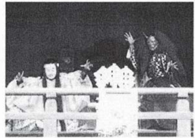
相模里神楽垣澤社中のみなさん

明るく輝いていた満月が赤銅色に染まっていく様子は大変ドラマチックで、これまで多くの記録に残されてきました。