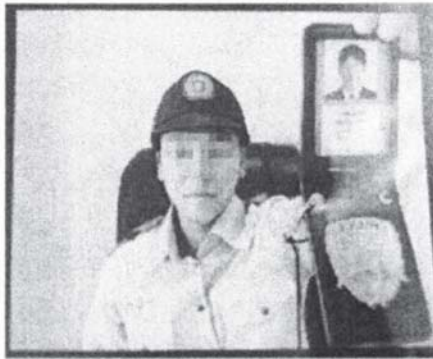
実際に使われたニセ警察官の画像 (画像の一部を加工)

警察がメールや各種SNSで警察手帳や逮捕状をアップしたり、インターネットバンキングで口座を開設するように指示することは絶対にありません!!警察がお金やキャッシュカードを要求することは絶対にありません!不審な電話がかかってきたら、話を鵜呑みにすることなく、一旦切って、家族や警察に相談しましょう。