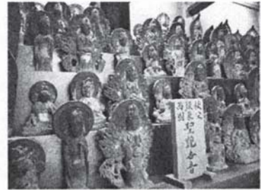
第五番札所 久保沢観音堂