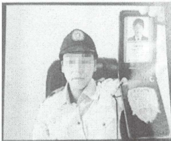
実際に使われたニセ警察官の画像 (画像の一部を加工)

警察がメールや各種SNSで警察手帳や逮捕状をアップしたり、インターネットバンキングで口座を開設するように指示することは絶対にありません!!