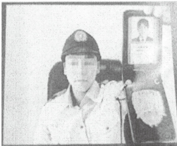
実際に使われたニセ警察官の画像 (画像の一部を加工、警視庁提供)

警察がメールや各種SNSで警察手帳や逮捕状をアップしたり、インターネットバンキングで口座を開設するように指示することは絶対にありません!!