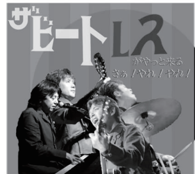
ザ ビートルズ…相模原や多摩地区を中心に活動するビートルズのトリビュートバンド。