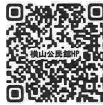
横山公民館ホームページ