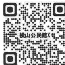
横山公民館のX(旧ツイッター)

E-mail: yokoyama-k@city.sagamihara.kanagawa.jp