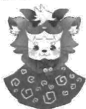
横山地区のキャラクター「よこそうくん」です。