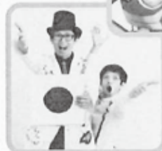
キャラメル マシーン