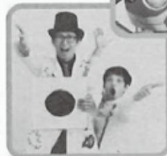
キャラメル マシーン