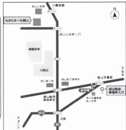
▲もみじホール城山 会場案内図

【会場・お問合せ】(公財)相模原市民文化財団 もみじホール城山 ☎042-783-5295(10:00~19:00)