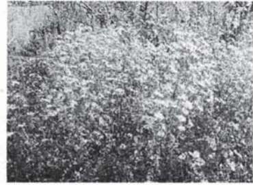
大島地区に咲くカワラノギク 撮影2022・11・8