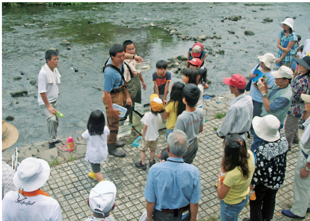
水生生物の勉強会でNPOの方の説明を受ける参加者