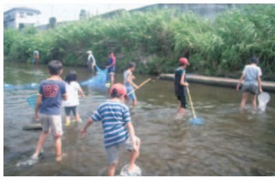
水生生物の採取に向かう子どもたち

水生生物の勉強会には子どもとその保護者が多く参加しています。勉強会を担当する方々は、境川の昔を知る年配者の方から、子どもたちにもいろいろと教えていただきたいと考えていますが、年配の方の参加は少ない状況です。子どもたちの行事として捉えられていないのではないかと分析しています。 平成20年度からは近隣の自治会にも勉強会