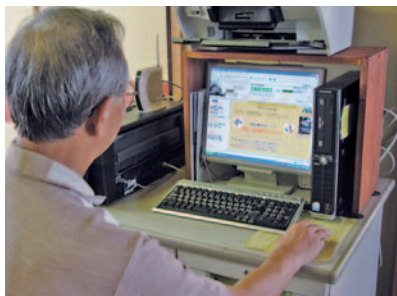
このパソコンで作成しています。

東西に2キロメートル、南北に1キロメートルの広大な区域と2000世帯以上もの会員数を抱える宮下自治会では、約2年間の準備期間を経て平成18年度から自治会独自のホームページを公開しました。 この公開により、自治会広報紙や回覧板では限りのあった、自治会内の情報や写真をより多く発信できるようになり、加えて自治会内の出来事や行事の開催情報をすばやくホームページ上に公開することで、最新の情報を手軽に共有できるようになりました。現在はトップページをはじめ70テーマを超える分野を公開しています。その内容は、自治会内の