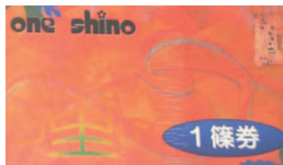
拡大するとこんな感じです

地域の畑での農業体験などの体験型事業、のびるっ子会（市認定保育園）の運営、金曜日に行われる保育園児の保護者向けお茶会『里カフェ』、わはは（子育てサロン）の運営、たくみの会（ロバの音楽会・鳥の巣箱作り）、炭焼きクラブ（炭焼きの体験学習）、食堂部会（レストラン運営）、地域通貨とも言える『篠券』の発行等と幅広いものとなっています。