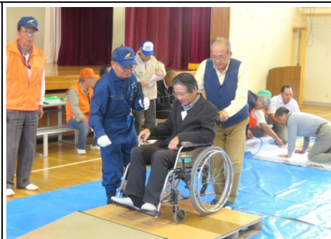
車いす訓練の様子