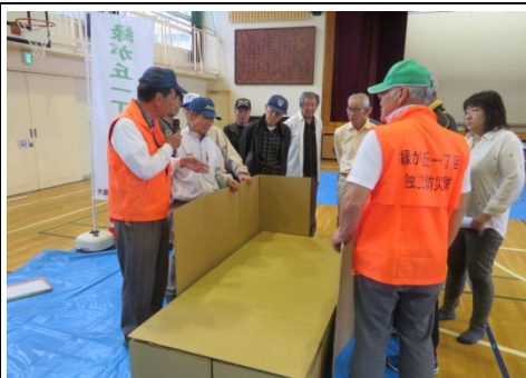
ダンボールベット組立の様子

最後に、前期及び後期の講習を4回以上受講した参加者には、「卒業証書」が交付されました。