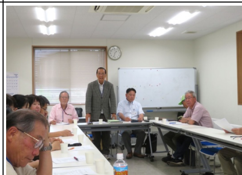
堀口会長挨拶の様子

本年度、マイスター会の会員は40名となり、そのうち26名が参加して開催されました。自治連割柏会長挨拶、堀口会長挨拶、出席者の自己紹介に続いて、平成30年度事業、会計報告、令和元年度事業計画基本計画(案)が提示され承認されました。その他、特別講演会について、黄色い旗について、防災講座の開催について、講演用パワーポイント作成などの説明がありました。