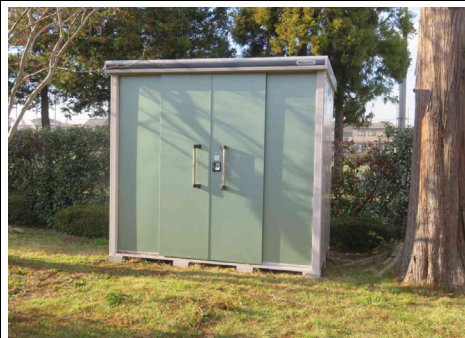
設置された防災機材倉庫1