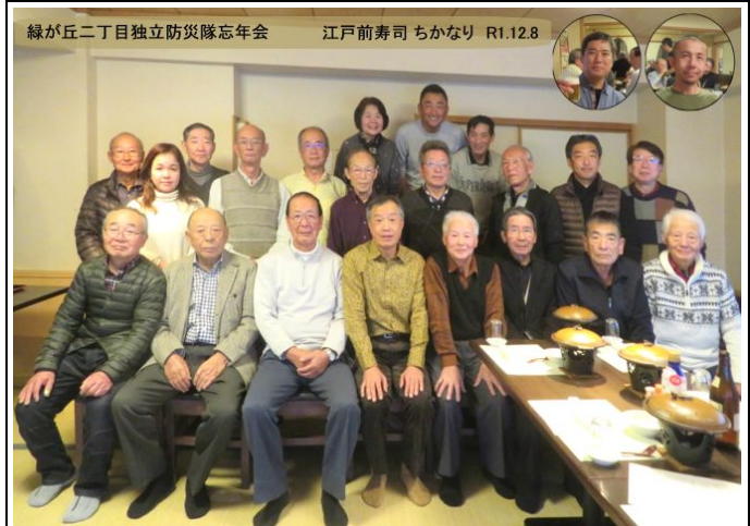
定例会兼忘年会に参加した隊員の皆さん