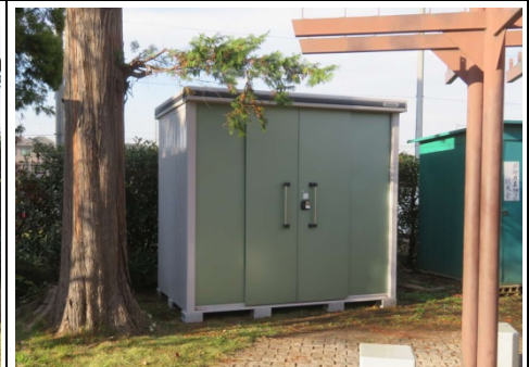
設置された防災機材倉庫2