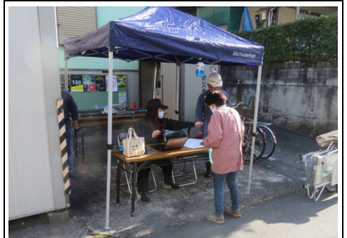
安否情報整理シートの受付

また、「黄色い小旗」掲出訓練も実施され、各班長が安否確認を行い自治会館前の受付に安否情報整理シートを提出しました。