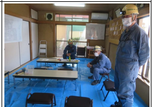
自治会館1Fの災害対策本部