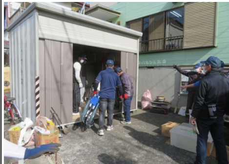
自治会館前の防災倉庫

従来からの自治会館前、緑が丘2丁目公園駐車場隣接地の防災倉庫・防災機材倉庫の3か所に保管されている備品を機能的に使用できる様に整理しました。 尚、自治会館前の倉庫には災害本部開設時に使用する備品などを移動して保管しました。