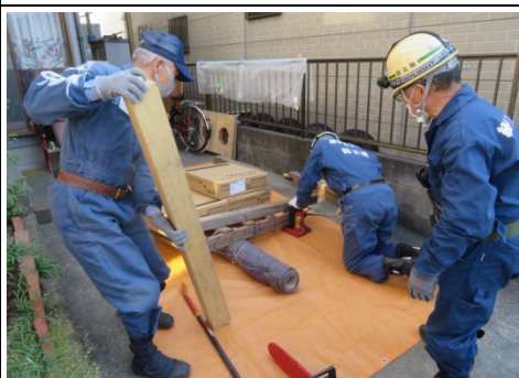
けが人救出訓練の様子