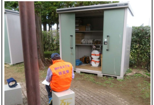
いしの小径公園内の防災倉庫