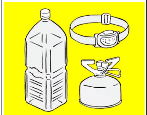
防災ブック「東京防災」より

防災 まめ 知識 在宅避難 ●ガス・電気・水道の代替： ライフラインの代替品を備えておく安心。ガスはカセットコンロ、電灯は乾電池で作動するヘッドランプを利用します。水は日頃からペットボトルなどの水を多めに準備し、近所の「給水拠点」の確認をしておきましょう。 ●下水道の使用方法： 下水があふれ出すことがないか、自宅の排水設備が破損していないかなどを確認。道路に下水があふれるなど下水道が使用できない場合には、 備蓄している携帯用トイレや行政が用意したトイレ を利用します。