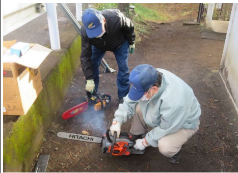
チェーンソー点検の様子