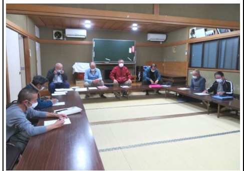
令和2年度 第9回 定例会の様子