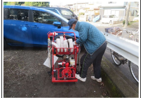
D級ポンプ点検の様子