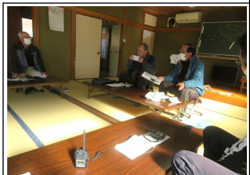
通信方法確認中の様子

先月実施された情報伝達訓練に於いて、無線機相互間の混信の問題があり 緑2・自治会館 に於いて虹ヶ丘独立防災隊と対応方法の確認を行いました。 同隊よりUCコードを使用した対策案の提示があり 、各防災隊のグループ分けは可能となる事を確認できましたが、 グループが同時には通話できない事から 、無線機の保有台数の多い防災隊は、 現在割り当てられていないチャンネルを使用する方向 となりました。