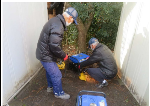
発電機点検の様子

器具のメンテナンスと隊員のスキルアップを目的として原則毎月第1日曜日に緑が丘2丁目公園駐車場隣接地に於いて 防災機具の点検を実施しており 、本日は 緑2・隊員9名 が参加しました。