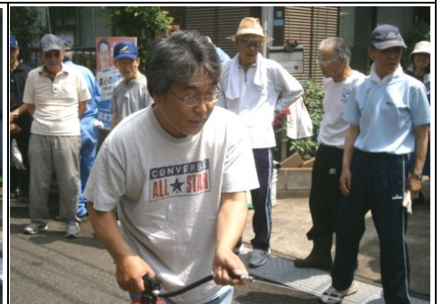
男性による消火訓練の様子