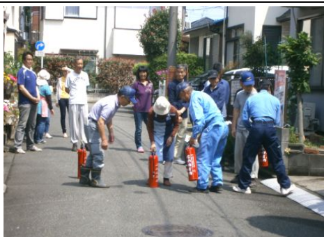
地区の防災隊員の指導の様子