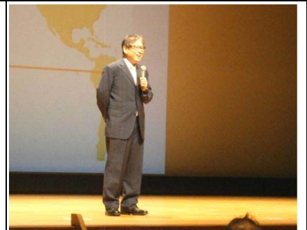
TVでお馴染みの森田さん