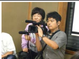
映学社の監督とカメラマン