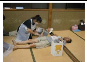
大腿骨折の応急手当