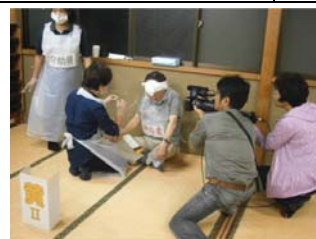
目の負傷の応急手当