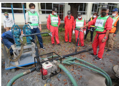
給水場設置の確認