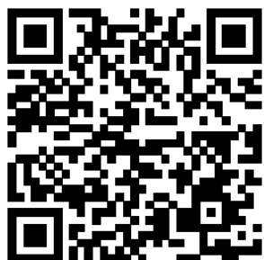
緑2・掲示板URL(QRコード)