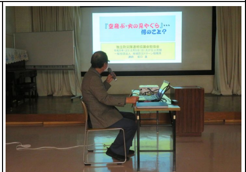
堀口代表理事の講演