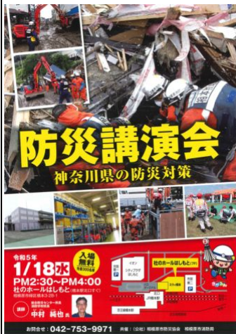
防災講演会のチラシ