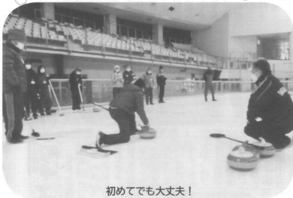
初めてでも大丈夫!

陽光台公民館体育部主催の初事業「カーリング教室」が12月24日(土)に銀河アリーナの早朝時間を貸切り開催されました。