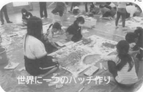
世界に一つのバッチ作り

り、とても楽しそうでした。絵の具が乾くの待つ間に部屋を移動して、缶バッチの大ききの台紙に好きな絵を描いて、バッチを作る機械にセットしたら自分でのバッチが完成です。次に乾いた絵の好きな部分を切り取って作った2つの目のバッチは、絵の具の模様が全体に広がってまるで宇宙のように美しいものが多かったです。機械の補助をしてくれていた先生から「きれいだね、写真撮ってもいい？」とほめられて嬉しそうにはにかんだ笑顔がたくさん見られました。