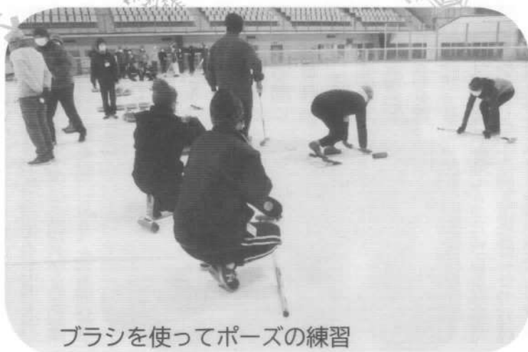
ブラシを使ってポーズの練習

ます。ストーンのハンドル部分を回しながら手を離しますが、時計回りに回転させると右側に曲がり、反対側に回転させると左側に曲がります。すぐにコツをつかんで投げる人、毎回転んでしまおう人と様々でしたが、講師の方の丁寧な指導により参加者全員なんとかストーンを投げる事ができていました。