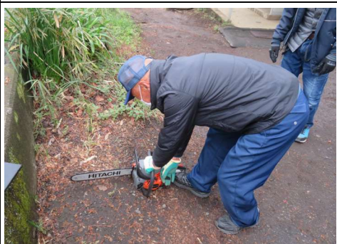
チェーンソー点検の様子

器具のメンテナンスと隊員のスキルアップを目的として、原則毎月第1日曜日に、緑が丘2丁目公園駐車場隣接地に於いてチェーンソー、発電機、小型消防ポンプ等の防災機具の点検を行っており、本日は隊員10名が参加して実施されました。尚、10月まで8時30分の開始時間となります。