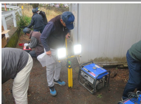
LED投光器点検の様子