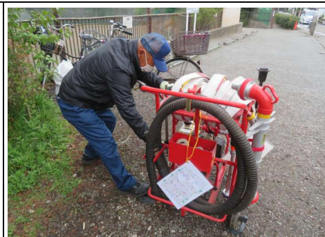
D級ポンプ点検の様子