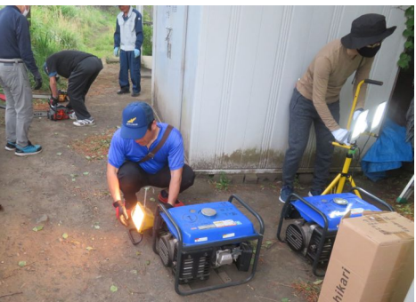
投光器点検の様子

器具のメンテナンスと隊員のスキルアップを目的として原則毎月第1日曜日に緑が丘2丁目公園駐車場隣接地に於いて 防災機具の点検を実施しており、本日は防災隊員13名が参加しました。