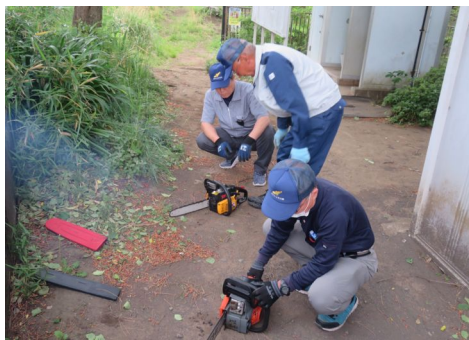
チェーンソー点検の様子