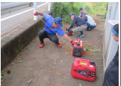
発電機点検の様子