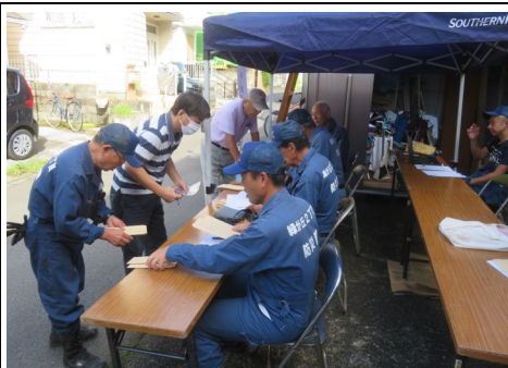
安否情報整理シート受領の様子