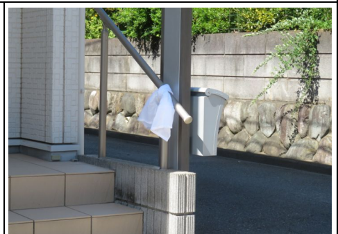
「白いタオル」掲出中の様子