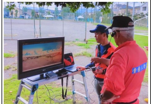
ドローン操作中の様子