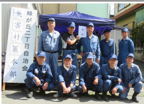
本部前に集合した隊員

今回は初の試みとして、光が丘地区の自治会員は「黄色い小旗」、非自治会員は「白いタオル」掲出による安否確認訓練が実施されました。当日は隊員10名が自治会館前に集合「災害対策本部」テントを設営、本部では班長からの安否情報整理シートを各地区長が受領、防災隊長へ結果を報告しました。尚、緑2自治会員の掲出率は84.7%、非会員掲出数：103件でした。