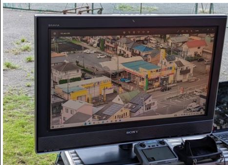
上空から撮影したドローン映像