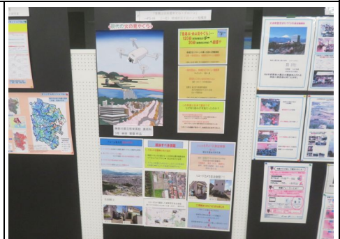
オリジナルセッションの展示