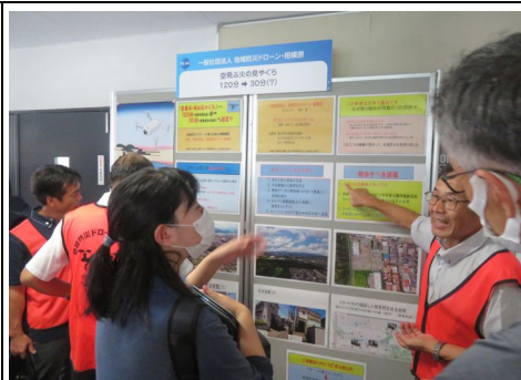
ポスターセッションの様子