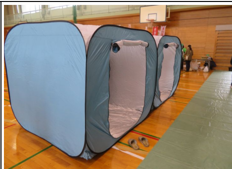
仕切りテント組立の様子