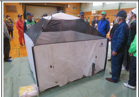
ひなんルーム組立の様子