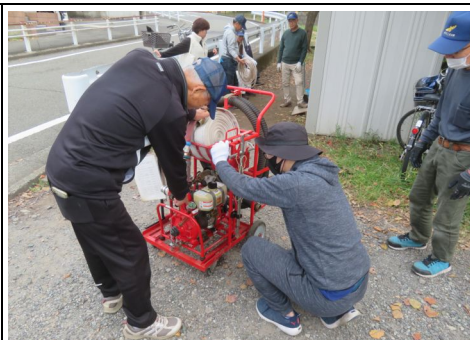
D級ポンプ点検の様子