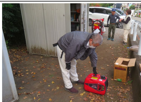
発電機点検の様子