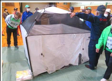
避難所に新たに配布されたテント

避難所では、大勢の人で1つの空間を共有して生活することになるため、プライバシー・プライベート空間の確保が困難で、窮屈な生活から精神面、身体面で病んでしまうことが問題とされています。市から新たに70台のテントが配布されたことにより、プライバシー・感染予防に役立つものと思われれます。また体育館の収容力も増えることとなります。