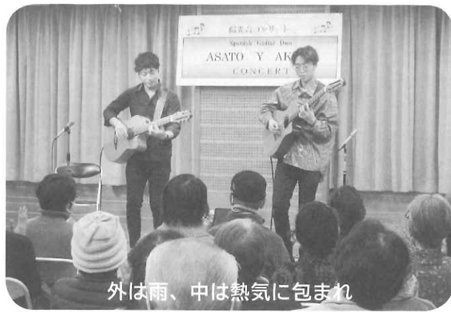
外は雨、中は熱気に包まれ