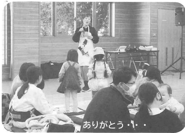
ありがとう・・・

エンディングはRUUさんのオリジナル曲「ありがとう」「ハッピーハッピー」の2曲の熱唱でした。「一番近くにいる人」にありがとうと伝えてほしい」というメッセージは参加された全員の心に伝わっ