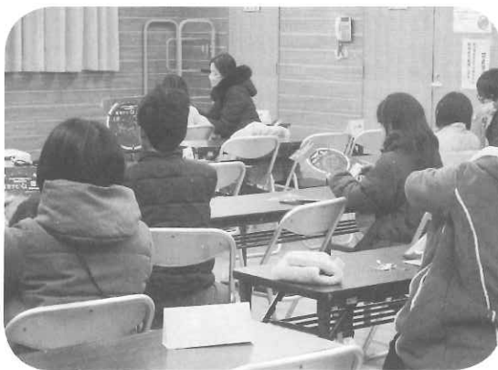
星座早見表づくり

未就学児を含む14名のお子さん、保護者の方たちもキラキラ光っている星空にわくわくしながら望遠