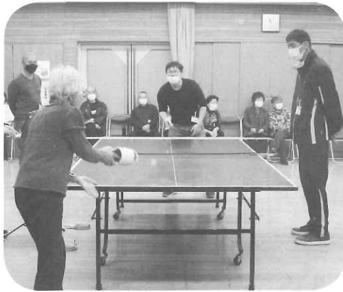
なかなか慣れません

山形県河北町で考案された珍スポーツとして知られる「スリッパ卓球大会」が体育部主催で1月28日(日)に公民館大会議室で開催されました。老若男女が集まり1チーム3人で9チームをくじ引きで作りました。3台の卓球台に3チームずつ分かれて対戦します。2試合行われ、1試合で1人2ゲーム、合計4ゲームを戦いま