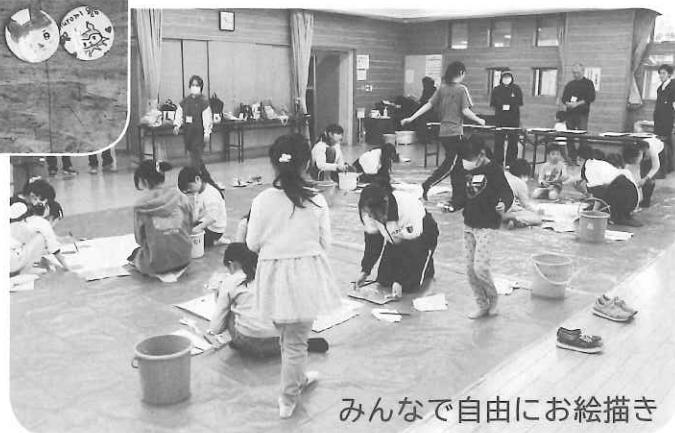
みんなで自由にお絵描き

紙にバッジになる 大ききの枠が印刷さ れていて、その枠の 中に思い思いの絵を 描いていきます。出 来上がったらプラス チックコーティング と一緒に機械で打ち 抜き、缶バッジにプ レスして完成。世界 で一つだけのバッジ の出来上がりです。