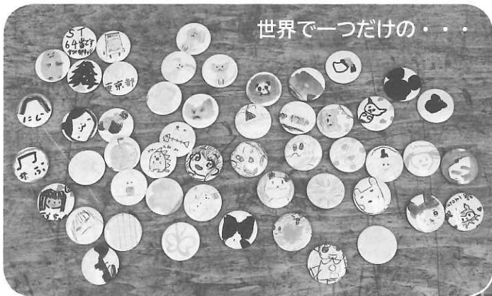
世界で一つだけの・・・

紙にバッジになる 大ききの枠が印刷さ れていて、その枠の 中に思い思いの絵を 描いていきます。出 来上がったらプラス チックコーティング と一緒に機械で打ち 抜き、缶バッジにプ レスして完成。世界 で一つだけのバッジ の出来上がりです。