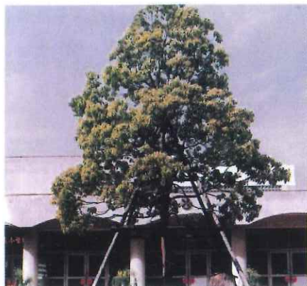
平成元年の植樹時

相模原市立青葉小学校は、昭和53年4月に光が丘小学校、並木小学校から分かれて新しく開校しました。開校当初は桜30本、いちょう50本が植えられたそうです。青葉小学校のシンボルツリーとなった「くすの木」は平成元年に植樹されました。「思いやりの心をもった明日を生きぬくたくましい子の育成」の教育目標のもと、誰にでも優しい、思いやりあふれた子どもたちが、この学校の中で多くの経験を通してたくましく育っています。現在（令和6年2月）の児童数は、264名ですが、昭和55年、56年の一番多いときで1,000名を超える児童が登校していました。しかし、青葉小学校は、少子化に伴う児童数の減少のため、令和7年3月に47年間の歴史に幕を閉じることとなりました。