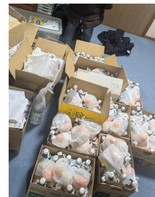
写真: 来ていただいた方へお配りする丸もち等を準備する様子です