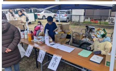
写真: 受付を用意し、来ていただいた方へお菓子やお土産をお渡ししています