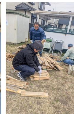
写真: 使用しなかった材木を片付けています