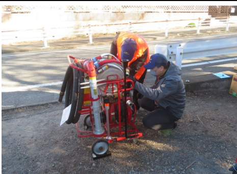
D級ポンプ点検の様子