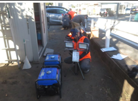
LED投光器点検の様子