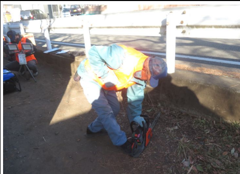
チェーンソー点検の様子

毎月第1日曜日に緑が丘2丁目公園駐車場隣接地に於いて小型消防ポンプ、チェーンソー、発電機などの防災機具の点検を行っており、 本日は緑2・防災隊員9名が参加して実施されました。