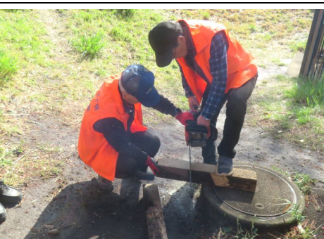
材木切断訓練の様子