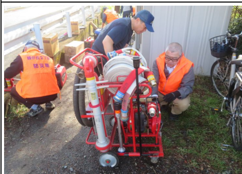
D級ポンプ点検の様子

器具のメンテナンスと隊員のスキルアップを目的として、毎月第1日曜日に発電機、チェンソーやD級消火ポンプなどの点検を緑が丘2丁目公園防災倉庫周辺等に於いて実施しており、本日は緑2・防災隊員12名が参加して実施されました。 また点検終了後には購入資機材の中で、チェンソーとジャッキの取扱い、操作の習熟訓練も合わせて実施されました。尚、毎月の点検は4月より10月までは8時30分の開始時間となります。