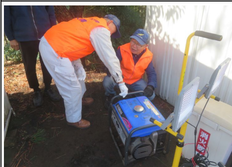
発電機点検の様子