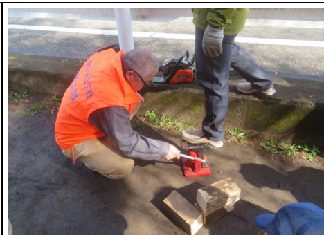
ジャッキ取扱い訓練の様子