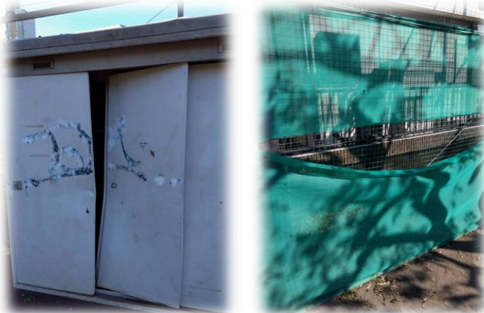
令和7年中、ふれあい広場・こども広場の倉庫・ネット、ブロック塀が破損する残念な出来事が続きました(左:倉庫、右:ネット)。