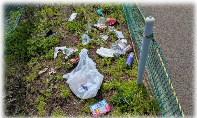
先日はふれあい広場周辺で、飲食後のゴミが散乱していました。とても残念なことではありますが、地域の設備は丁寧にそして綺麗に使うことを心掛けるよう、ご協力いただければと思います。