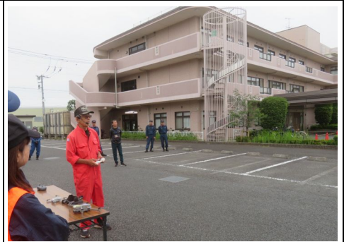
ドローン飛行実演の様子