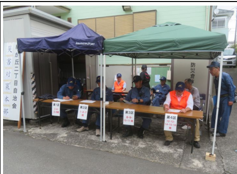
「災害対策本部」の様子