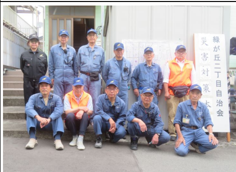
本部前に集合した防災隊員