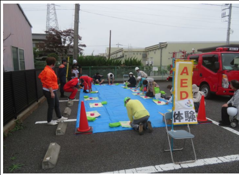
AEDと心臓マッサージ訓練の様子