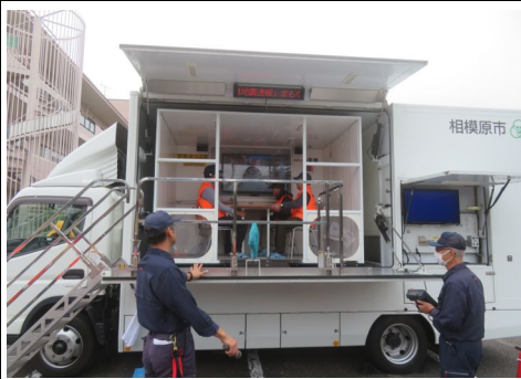
起震車体験の様子

今回の訓練には緑2・防災隊から7名が参加しました。開会式に引き続きA班、B班、C班の3グループに分かれ、A⇒B⇒Cの順で①水消火器を使った消火訓練 ⇒②煙体験、③起震車体験、④AED訓練、心臓マッサージ訓練を実施、最後にドローン飛行の実演(小菅さん)が行われました。