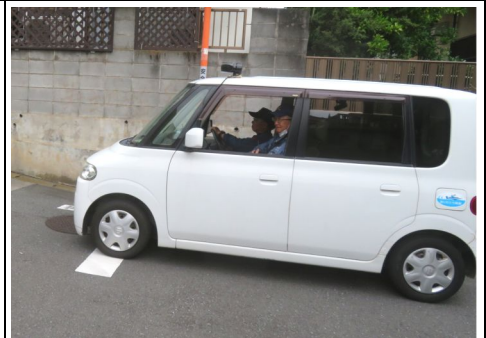
街宣車巡回の様子

なお本日の掲出率は街宣車の町内巡回による広報活動の効果もあり86.3%で昨年の73.8%より大きく改善しました。