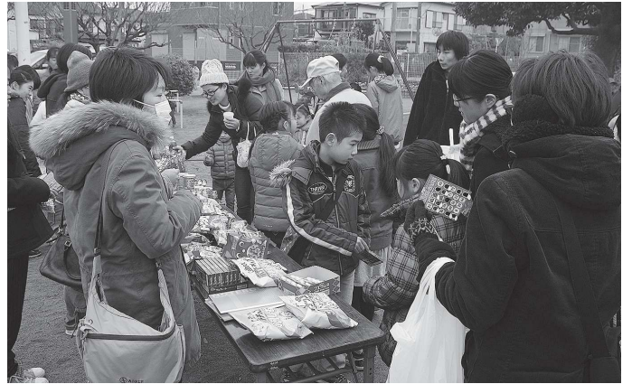
子ども達に人気のピンゴゲーム