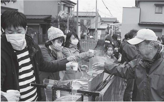
今年はノロウイルス猛威のため、餅つきの代わりにお汁粉を提供