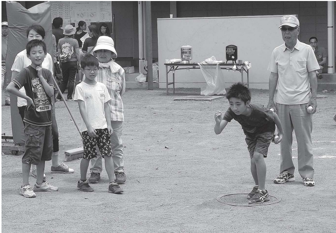
平成28年度レクリエーション大会

今回は四年生以上を対象に個人で応募してもらい見知らぬ者同士でチーム編成をして対戦してみました。