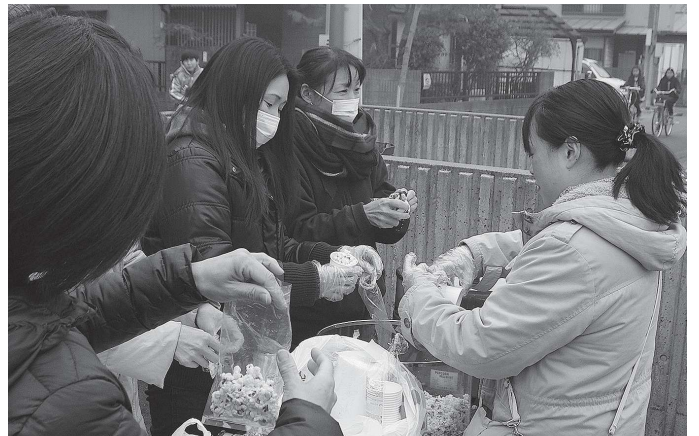
ポップコーンを丁寧に小包み