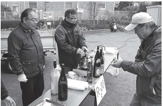
燗酒も始めてみました

来なくなると考え中止といたしました。 子ども達の参加が例年より少なかったのは「餅つき」中止の影響が少なからずあったのではないかと、推察しています。代わりに「お汁粉」と「燗酒」を立ち上げてみましたが、概ね好評の様子でしたので、今後も続けていければと思っております。 子ども達が「ピンゴゲーム」や「餅つき」「お汁粉」で賑わっているのを大人達が一杯やりながら見ている。 中々、ホノボノしていて良いのではと考えています。