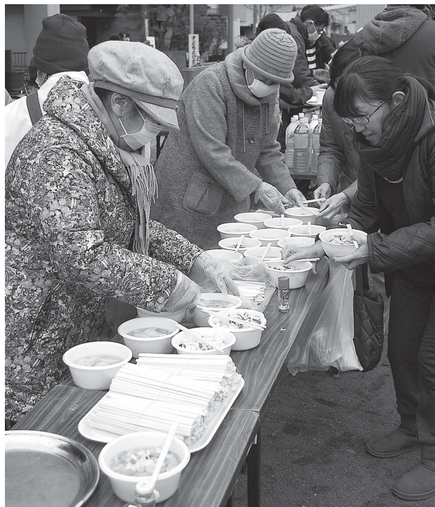
けんちん汁で身体が温まります