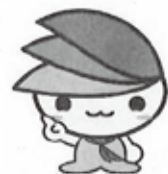
緑区イメージキャラクター

E-mail: tsukui-cen@city.sagamihara.kanagawa.jp