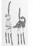
ウインドチャイムづくり