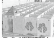
ダンボール迷路で遊ぼう!