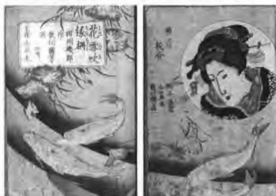
「花雪吹縁柵(はなふぶきえんのしがらみ)」