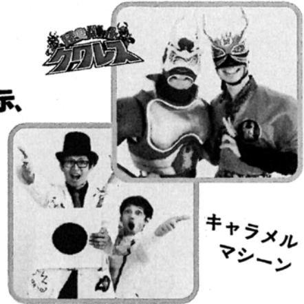
キャラメルマシンのサイエンスマジックショー

☆詳しくはホームページをご覧ください。 www.ecopark-sagamihara.com