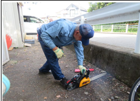
8月度チェンソー点検の様子

原則、毎月第1日曜日にD級消火ポンプ、チェンソーや発電機など緑2・防災隊が所有している防災機具の点検を実施しています。今月はチェンソーのエンジンが途中で停止する不具合があり、後日改めて機材管理班にて整備をする事にしました。