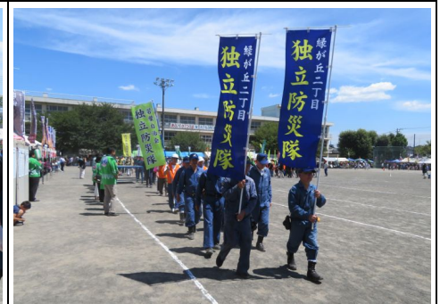
本部前を行進する緑2・防災隊員