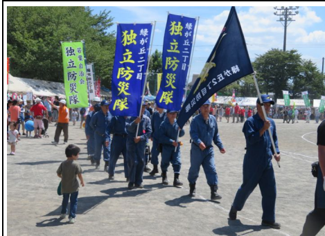
整列行進する緑2・防災隊員