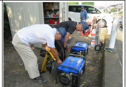
8月度発電機点検の様子